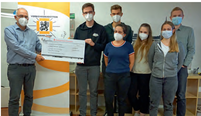
Von den Verkehrskadetten Düsseldorf beteiligten sich einige aktiv an der Challenge.

Einen ganzen Schwung Fotos reichten die Verkehrskadetten Solingen ein. Bei diesen fand die Übergabe des Preises nach Redaktionsschluss dieser Ausgabe statt.