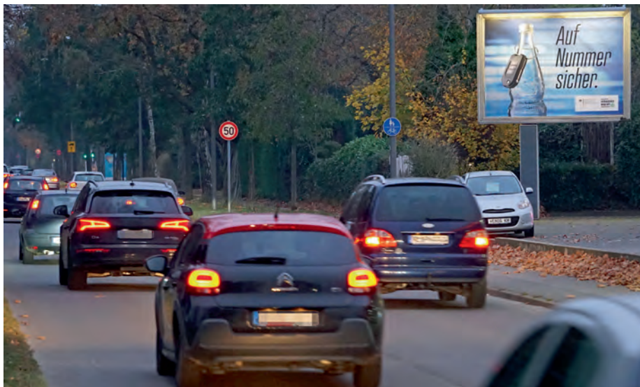
An viel befahrenen Straßen und zu einem Teil auch an beleuchteten Plakatwänden wird das Motiv „Auf Nummer sicher“ bundesweit bis in die Karnevalszeit zu sehen sein.

A uf Nummer sicher“ heißt es aktuell wieder auf vielen Plakatwänden in ganz Deutschland. Die Kampagne, die die Deutsche Verkehrswacht gemeinsam mit der Genossenschaft Deutscher Brunnen (GdB) durchführt, ist jetzt wieder gestartet. Die Plakate werden auf wechselnden Wänden bis nach Karneval zu sehen sein. Der Schwerpunkt liegt in diesem Jahr erstmals auf beleuchteten Plakatwänden, damit das Motiv mit der Mineralwasserflaschen auch im Dunkeln gut zu sehen ist und eine bessere Wirkung erzielt. Der Gesamtwert der Kampagne liegt bei 170.000 Euro, wovon 140.000 Euro der Bund und 30.000 die GdB tragen. Im gesamten Zeitraum der Kampagne werden insgesamt bis zu 228 Millionen Sichtkontakte erwartet.