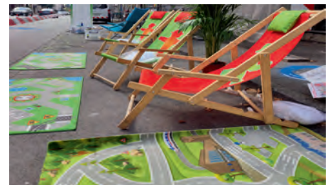
Verkehrsraum beim PARK(ing) Day

weiten Aktionstage zu Elektrorollern vor Ort an. Am Mannesmannufer gab es einen E-Scooter-Parcours, und es wurden Beratungsgespräche angeboten. Damit sollten Wissenslücken bei den Nutzern der so genannten E-Scooter geschlossen werden. Der Frage „Wie könnten unsere Straßen mit mehr Platz für Menschen aussehen?“ ging die VW Düsseldorf gemeinsam mit Passanten und Interessierten bei einem PARK(ing) Day im Rahmen der Europäischen Mobilitätswoche auf den Grund. Dazu wurde etwa auf einer viel befahrenen