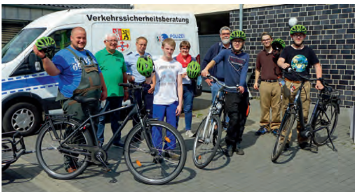
Die Teilnehmer des Fahrsicherheitstrainings können jetzt sicher von ihrem Wohnort zu ihrer Arbeitsstätte radeln - mit Helmen der KVW Heinsberg.

Eine Frau und fünf Männer haben das Fahrradsicherheitstraining im Bildungsbegleitzentrum der Lebenshilfe in Oberbruch erfolgreich bestanden. Sie hatten eine viermonatige theoretische Vorbereitung und ein dreitägiges Fahrradsicherheitstraining. Zunächst wurde auf dem Gelände der Lebenshilfe ein Übungsparcours absolviert. Anschließend erfolgte dann die praktische Durchführung im öffentlichen Verkehrsraum an verschiedenen Orten im Kreis Heinsberg. Die Teilnehmer wurden damit befähigt, selbstständig von ihrem Wohnort mit dem Rad ihre Arbeitsstellen aufzusuchen. Diese gemeinsamen Aktionen dienen dazu, dass Selbstwertgefühl zu steigern, Ängste abzubauen