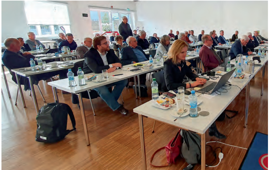
Die Hauptversammlung 2020 fand mit einem Großteil der Teilnehmer in Präsenz in den Räumlichkeiten von ABUS statt.