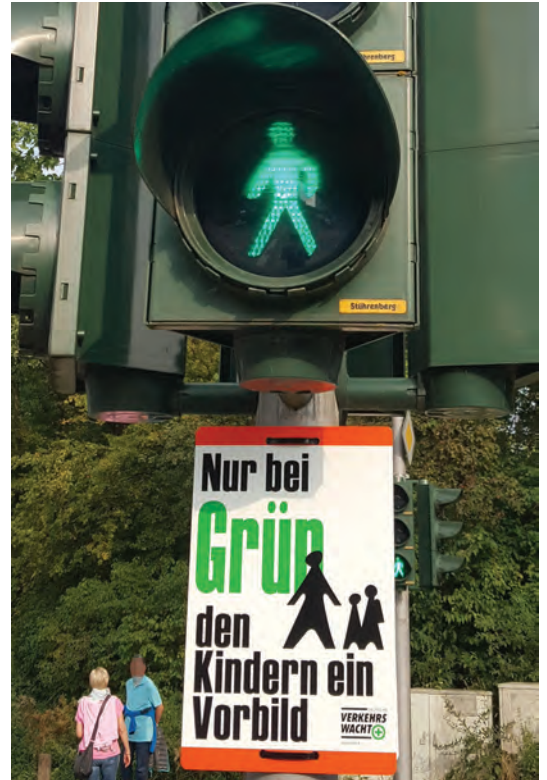
Nicht zu übersehen sind die neu befestigten Schilder an den Ampeln.

„Wir hatten seitdem ein gutes Dutzend positiver Rückmeldungen aus der Bevölkerung. Das bestärkt uns, mit diesem Projekt alles richtig gemacht zu haben“, sagt Becker Wochen später. Er fügt an: „Auch die Aufhängung unterhalb der Lichtzeichen scheint die richtige Entscheidung gewesen zu sein. Alle Tafeln hängen noch fest und sicher und sind weder beschädigt noch überklebt.“