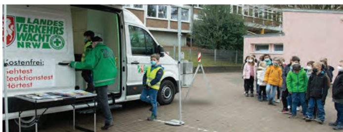
Die LVW war mit dem Infomobil vor Ort.