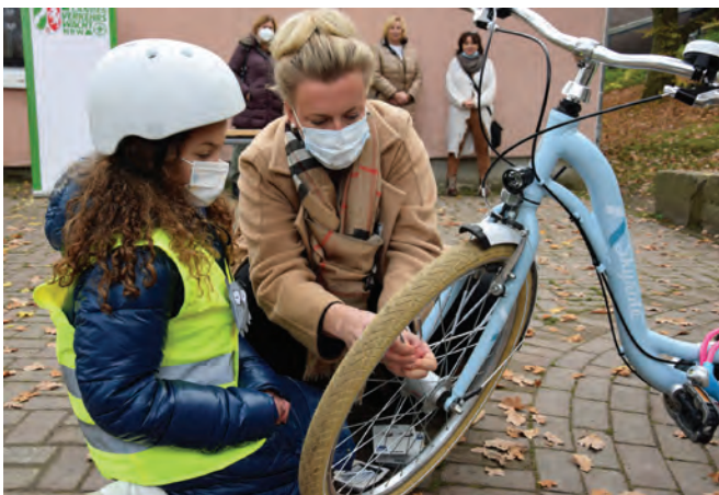
Verkehrsministerin Ina Brandes half dieser Schülerin bei der Befestigung der Speichenreflektoren.

S peichenreflektoren für 36.000 Fahrräder: Die stellt das Land NRW für die Schüler, die dieses Schuljahr ihre Radfahrausbildung machen, zur Verfügung. Das Parlament hatte einem Antrag von CDU und FDP zugestimmt, Gelder dafür bereit zu stellen. Die Verteilung läuft in den kommenden Wochen über lokale Verkehrswachen. Zur Auftaktveranstaltung kam NRW-Verkehrsministerin Ina Brandes in die Johannesschule nach Erkrath. Die dortigen Viertklässler erwarteten aufgeregt die Ankunft, um dann ganz konzentriert den kurzen Redebeiträgen, die vor der Übergabe der Reflektoren stattfanden, zuzuhören.