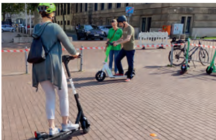
Die Aktion zu E-Scootern kam gut an.

VW Düsseldorf: Mit Aktionstag zu E-Scootern und PARK(ing) Day Bürger direkt angesprochen