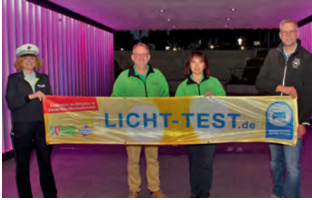
Mit Lichtspielen machte die KVV Kleve gemeinsam mit der Kreispolizeibehörde und der Kfz-Innung Niederrhein auf den Licht-Test aufmerksam.

Gemeinsam mit Partnern informierten die Verkehrswachten über den Beleuchtungsscheck