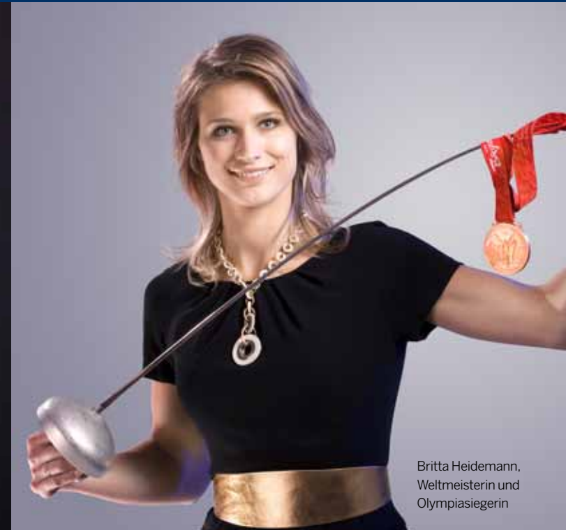
Britta Heidemann, Weltmeisterin und Olympiasiegerin